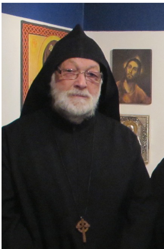
Diacre Cwyfan dans la chapelle de Sainte Gwenn

Il est difficile d'accepter qu'un homme si exubérant, si rieur, si plein de vie ne se trouve plus parmi nous. Mais, je crois que notre perte ici-bas est un gain pour ciel. Je pense que les anges auront fort à faire avec la multitude de ses imitations si drôles !