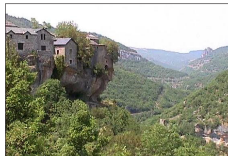
Village pittoresque de la région