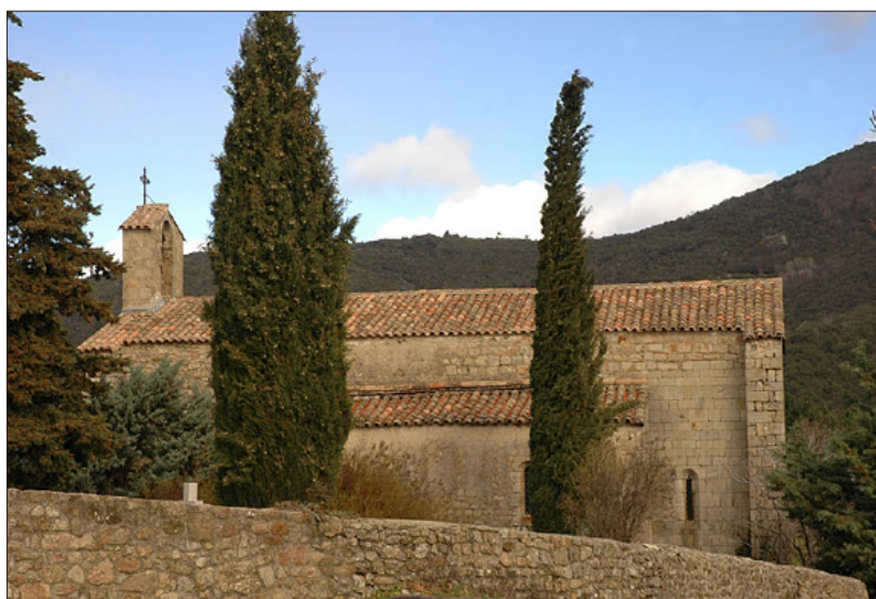
Église romane du XII e siècle

Le gîte se compose de neuf chambres pour nous héberger confortablement. Une large terrasse (plein sud) agrémentera notre séjour où l'on pourra prendre le petit-déjeuner dans la lumière matinale, après avoir médité et célébré la Liturgie Eucharistique.