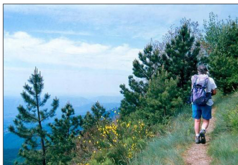
Nombreux sentiers de randonnées